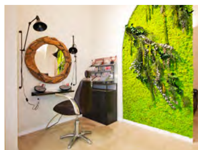
Il salone Caruso di Milano raddoppia i suoi spazi con una location ispirata alla natura e al vintage.