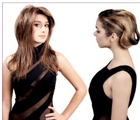
Hair: Maurizio Polverini e Polverini Academy Creative Team Make-up: Mariagrazia Bonarelli Styling: Zaira Leone