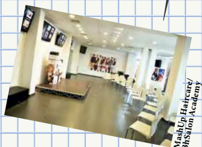
MashUp Haircare/BhSalon Academy